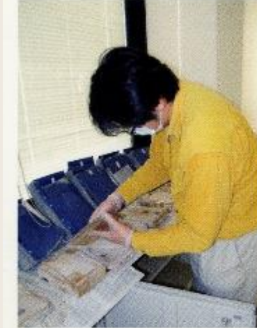
参考11 エタノールの噴霧 カビの状態を確認しながら、エタノールを噴霧して、カビの発生を抑制する応急処置を行う。