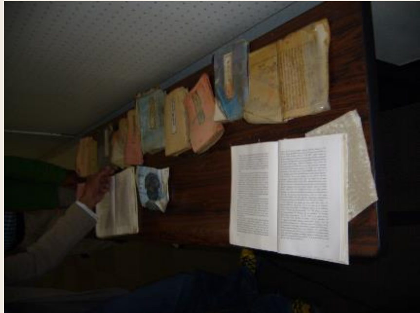
和歌山県立博物館「災害と文化財」より水害救出文化財