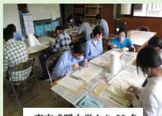
東京成蹊中学より39名