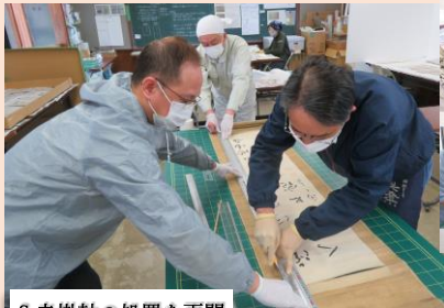
S寺掛軸の処置を再開