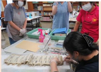
中尾先生による難関資料の開披実演