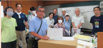
A地区に処置済絵図を返却