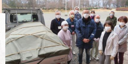
軽トラいっぱい処置済資料をN家に返却