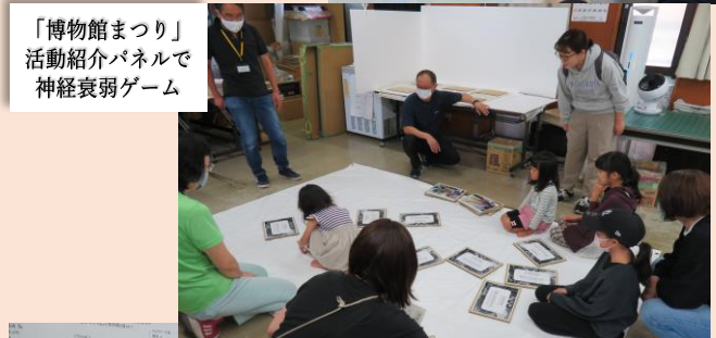
「博物館まつり」活動紹介パネルで神経衰弱ゲーム