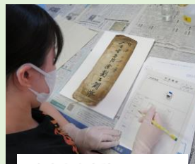
奈良大生卒論のテーマに