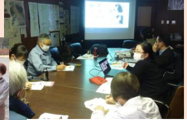
縄原考古学研究所:奥山先生中尾先生による乾燥剤凍結乾燥法の指導と講座